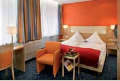
Ringhotel Loew's Merkur****