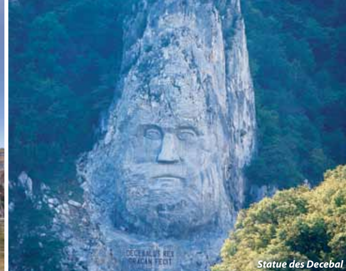
Statue des Decebal