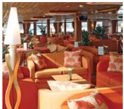
Salon / Bar