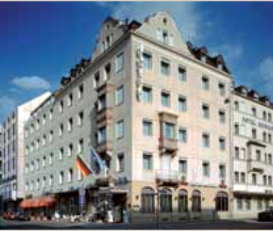
Ringhotel Loew's Merkur****

Sonntag 10.06.12 Nürnberg (Deutschland) - Luxemburg Frühstück im Hotel. Check-out und Fahrt im Reisebus zurück nach Luxemburg (Mittagspause unterwegs). Transfer zu Ihrem Wohnort.