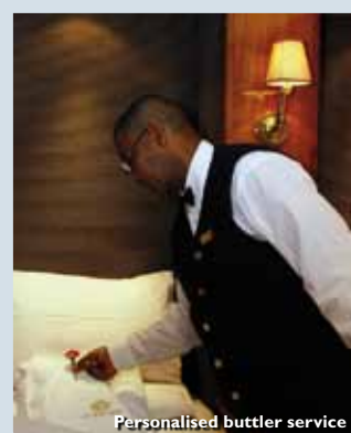
Personalised butler service