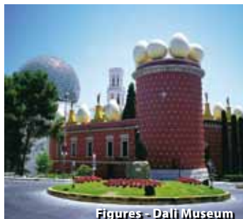
Figueras - Dalí Museum