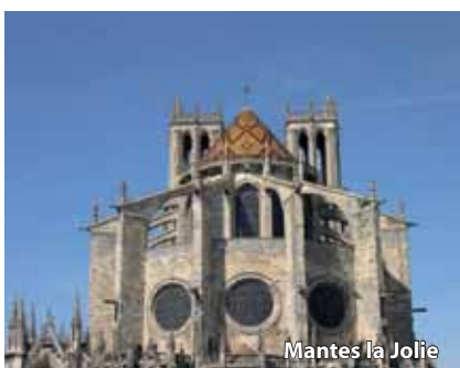
Mantes la Jolie