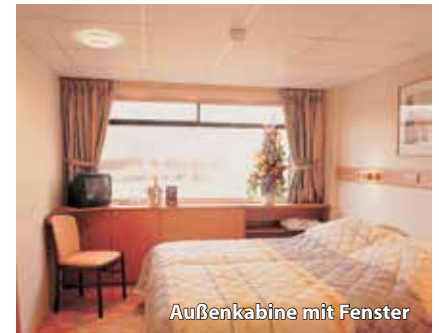
Außenkabine mit Fenster