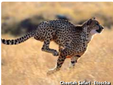
Cheetah Safari - Etoscha

Nach dem Frühstück im Hotel Check-out und Fahrt in Richtung Norden nach Otijwarongo. Besuch der „Cheetah Foundation“, wo Sie an einer Cheetah Safari